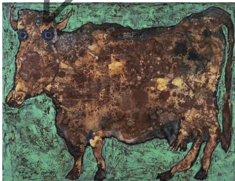
DUBUFFET: La vaca con la nariz sutil (1954)