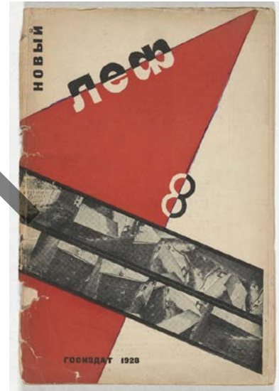
RODCHENKO: Portada de la revista Novyi LEF (1928)