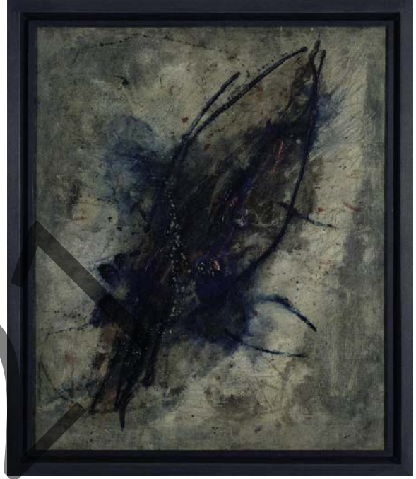
WOLS: Ala de mariposa (1947)