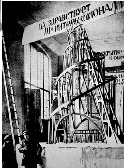
TATLIN: Maqueta del Monumento a la Tercera Internacional (1919)