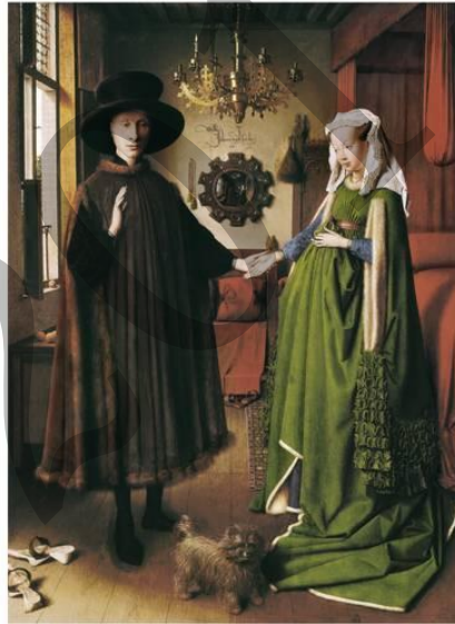
Arnolfini senar-emazteen erretratua - Jan Van Eyck, El matrimonio Arnolfini

Analiza estas dos imágenes: (2,5 puntos cada una)