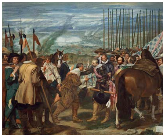
Bredako errendizioa (Lantzak), Diego Velázquez , La rendición de Breda (Las lanzas)