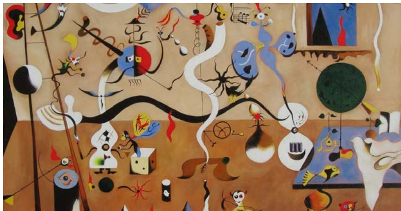
Arlekinaren inauteria - Joan Miró, El carnaval del Arlequín