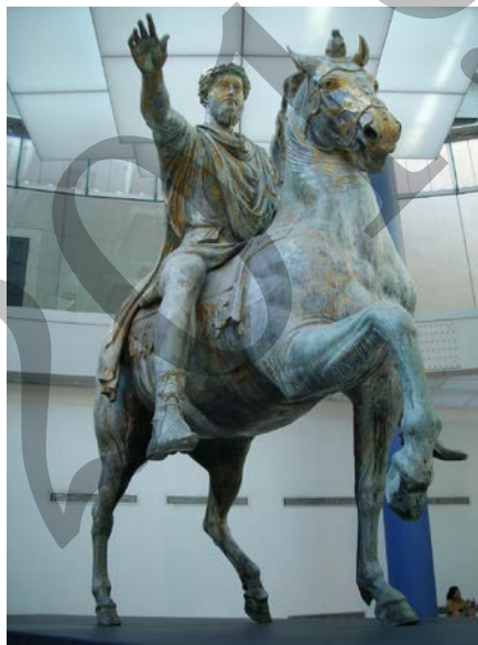
Marko Aurelioren zaldizko eskultura / Retrato ecuestre de Marco Aurelio

Analiza estas dos imágenes: (2,5 puntos cada una)