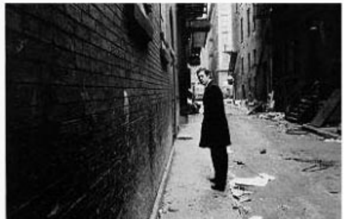
Chance Meeting (1970) Duane Michals