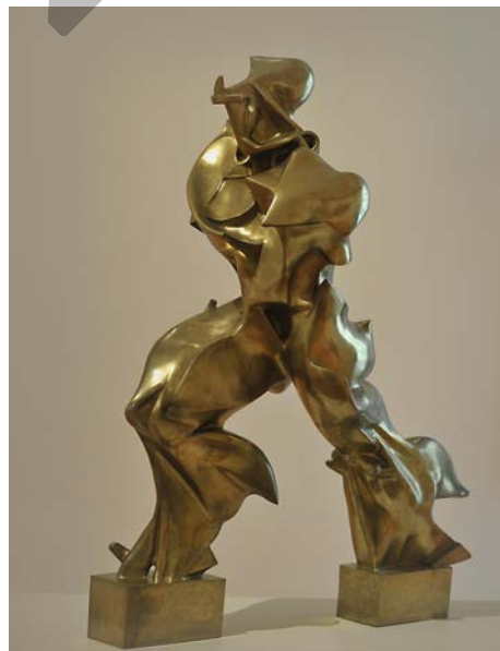
Espazioan zeharreko jarraitutasun-forma bakarrak Boccioni . Formas únicas de continuidad en el espacio