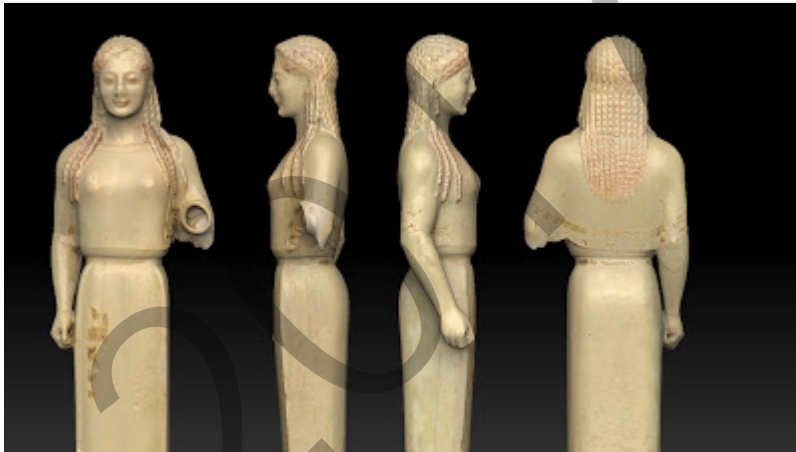
Kore peploduna / Kore del Peplu

Analiza estas 2 imágenes (2,5 puntos cada una):