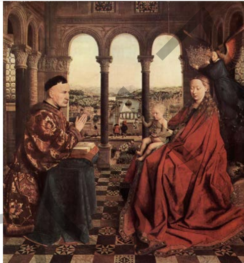
Rolin Kantzilerraren Ama Birjina Jan Van Eyck . La Virgen del Canciller Rolin

Analiza estas 2 imágenes (2,5 puntos cada una):