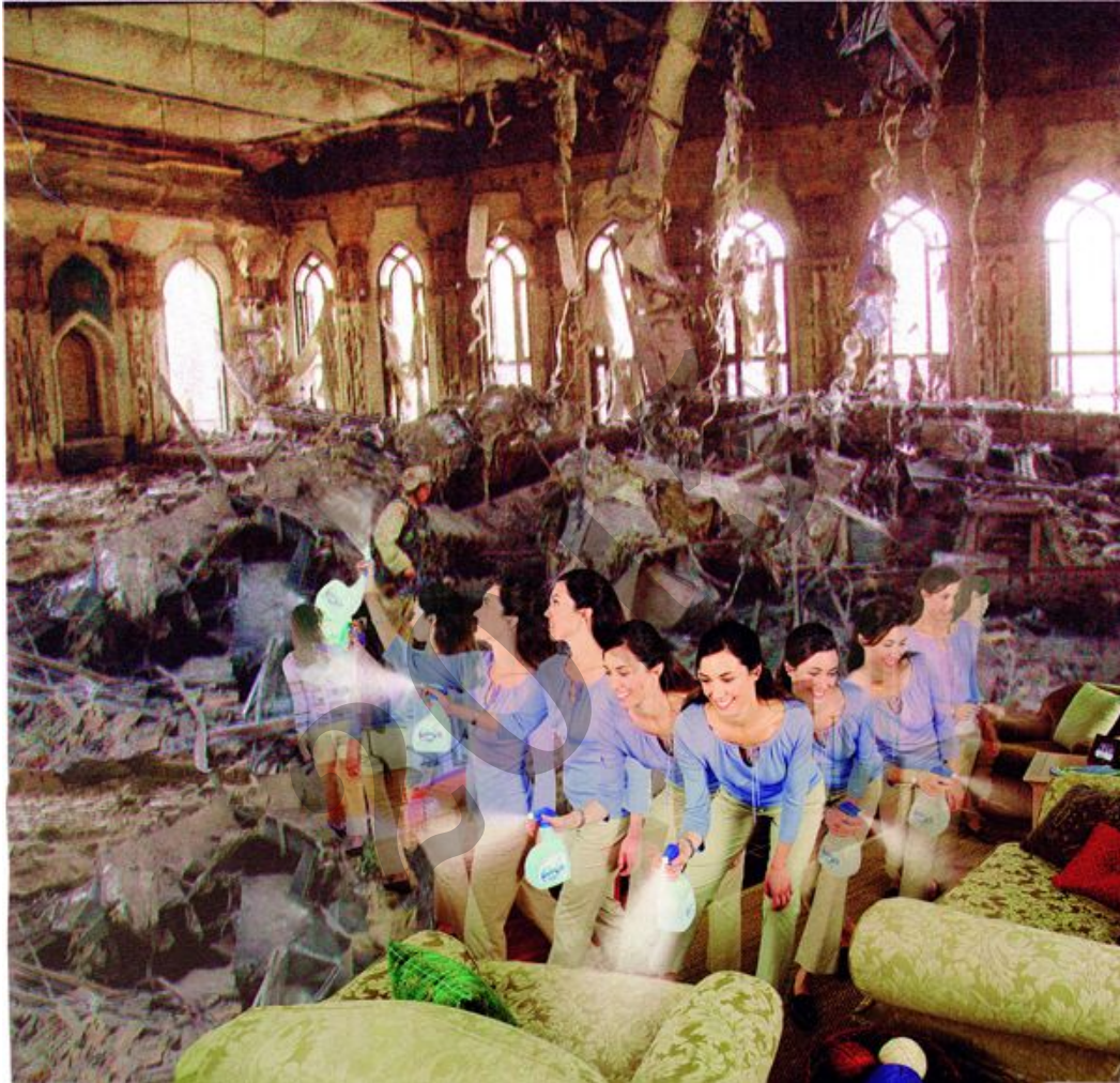
MARTHA ROSLER , " Saddam's Palace (Febreze) " 2004, de la serie " Bringing the War Home: House Beautiful " seriekoa.