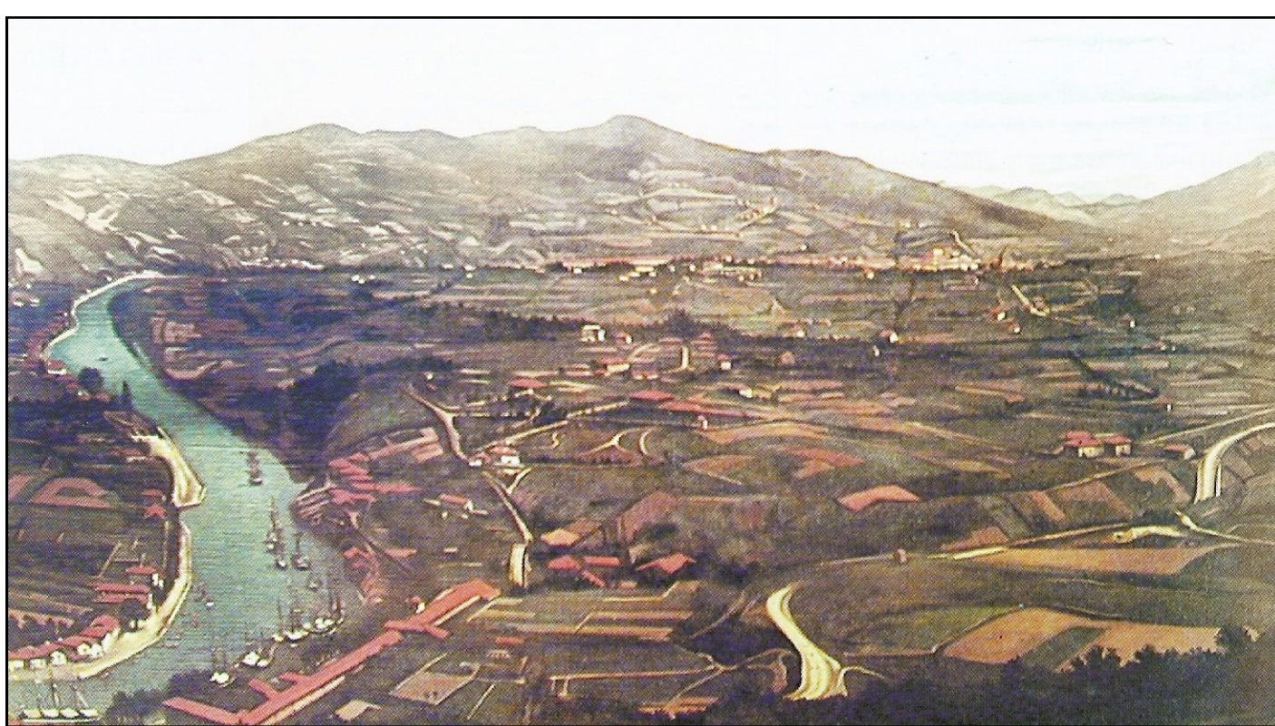
Fig. 2. Vista de la vega de Abando desde el monte Cobetas según una pintura del siglo XIX.