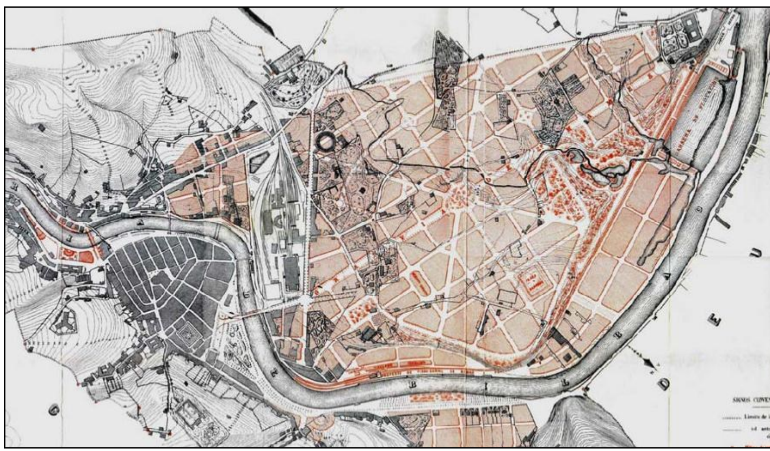
Fig. 1. Plano topográfico de Bilbao y Abando con la proyección del ensanche de Alzola, Achúcarro y Hoffmeyer de 1876.

El estudio subraya el fenómeno de la reserva social del espacio como elemento configurador del ensanche de Bilbao en el siglo XIX, y define la estructura de la propiedad como un factor que determina la morfología de la trama urbana y su ritmo de ocupación, al abrigo de un proyecto de titularidad municipal destinado a la misma clase propietaria: la burguesía bilbaína.