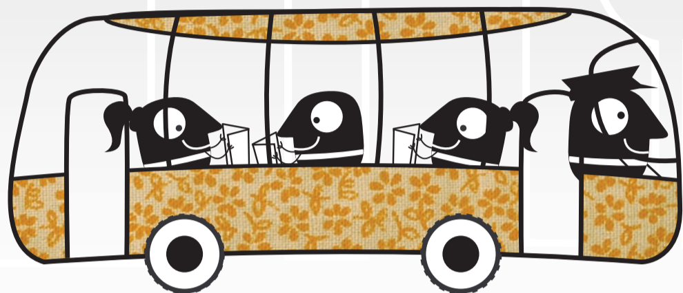
La sala de lectura