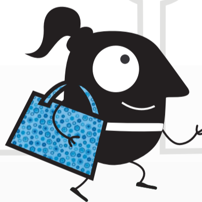
La sesión de meditación