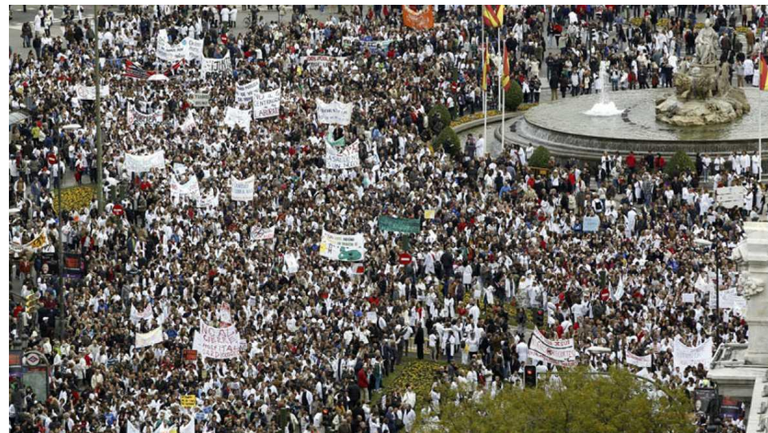
Marea Blanca (Sanidad)