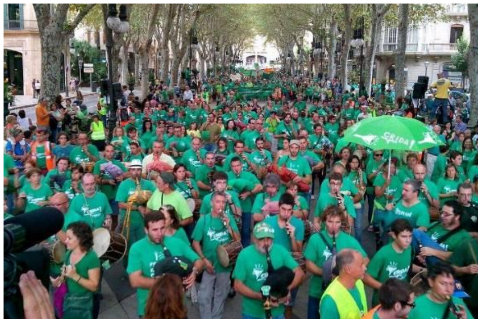
Marea Verde (Educación)