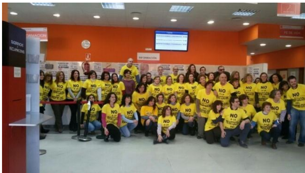
Marea Amarilla (Justicia)