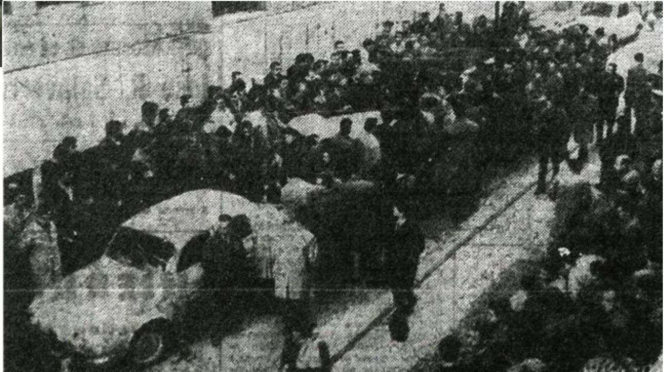
Huelga de Bandas de Laminaciones - Etxebarri