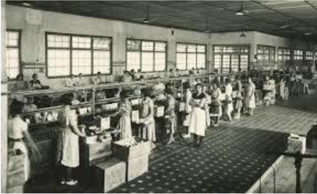
Fabrica de Galletas Artiach en Deusto