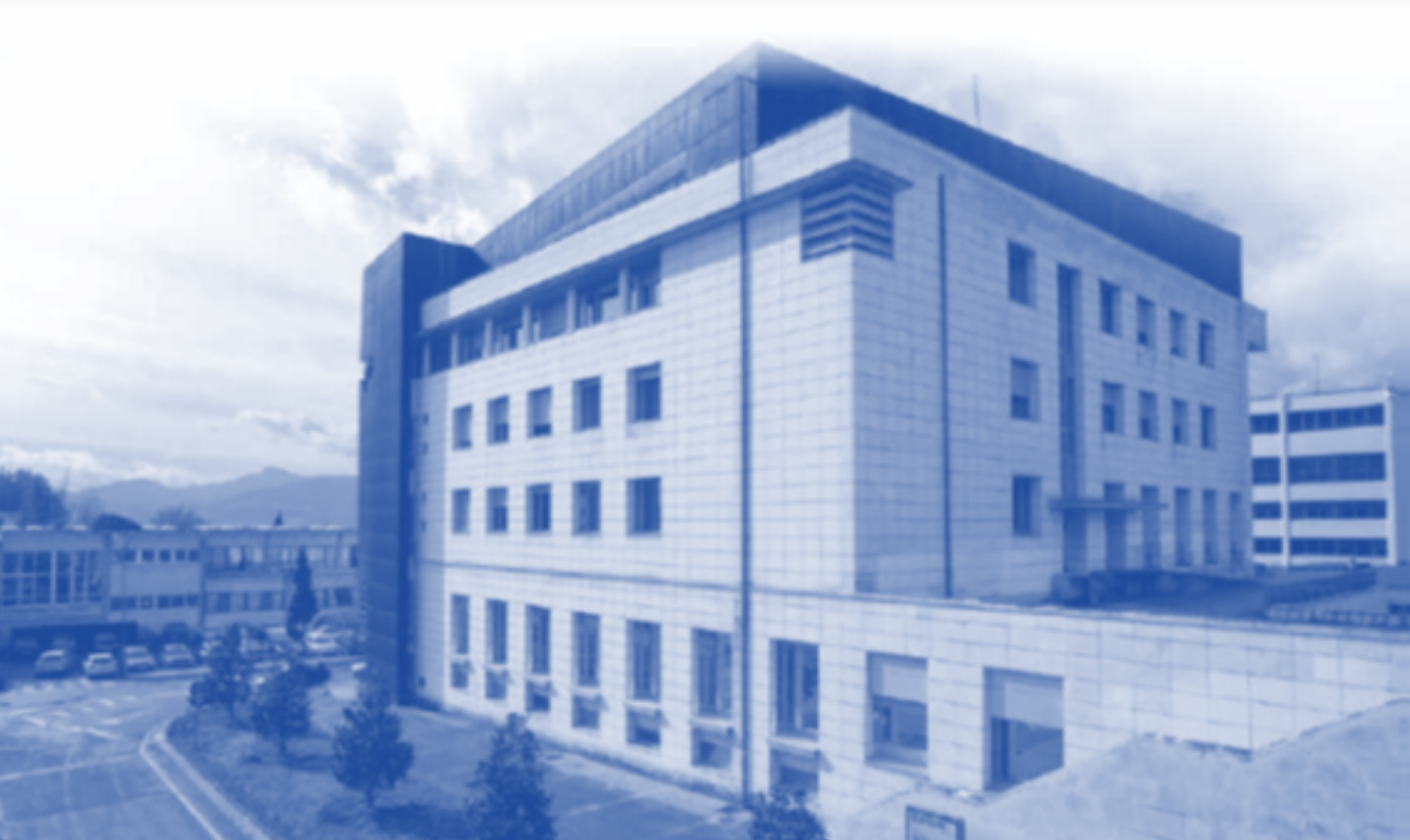
Lan harreman eta Gizarte Langintza Facultatea. Leioa Campusa.