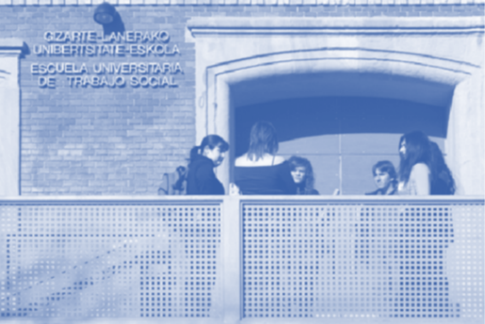
Lan Harreman eta Gizarte Langintza Facultatea. Araba Campusa.