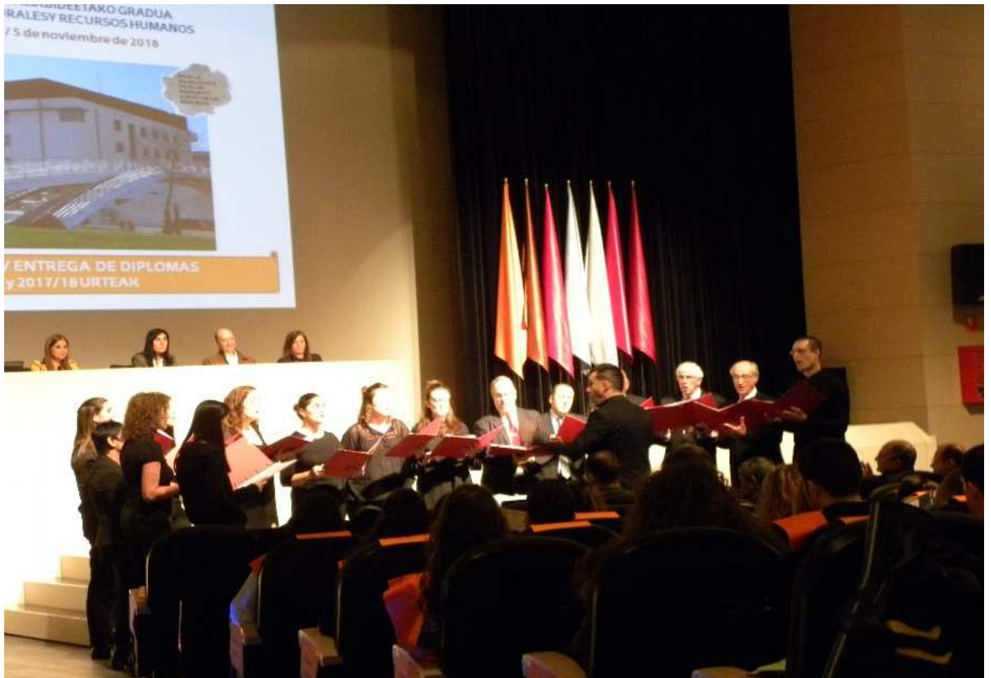
Lan Harreman eta Giza Baliabideetako Graduoko eta Laneko Segurtasun eta Babeseko Masterreko (2017-18 eta 2018-19) graduazio ekitaldia.