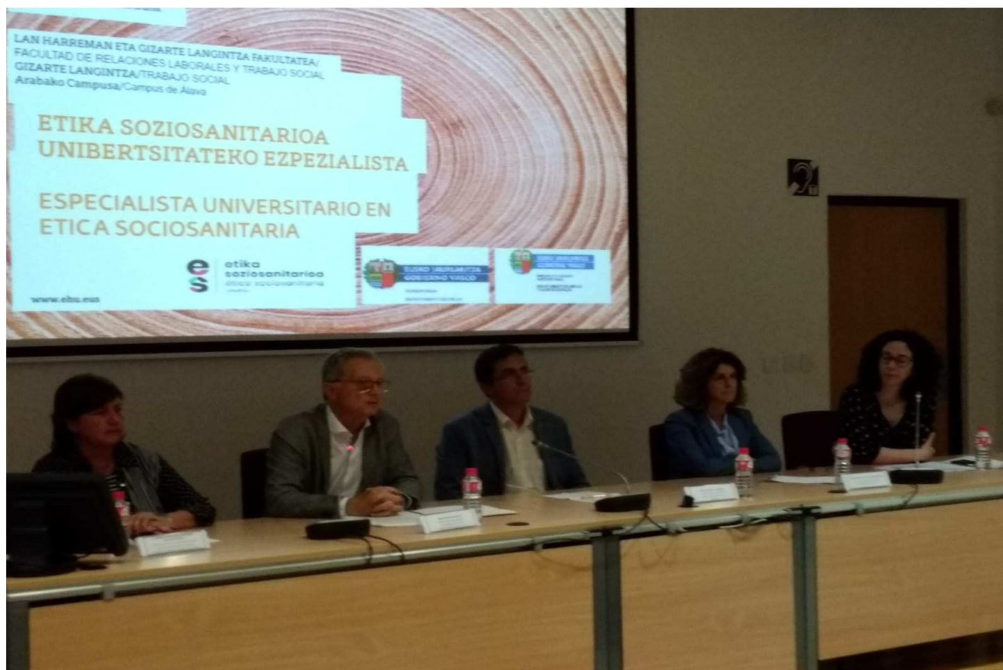
Etika Soziosanitarioan Espezialista Graduondokoaren aurkezpena