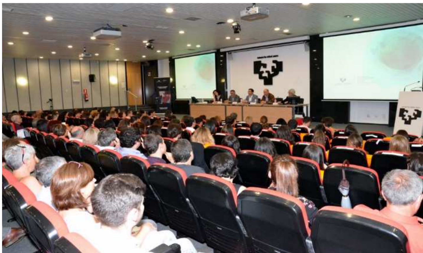
2017-2018 ikasturtean Gizarte Langintzako Gradua bukatu zuten ikasleen graduazio ekitaldia