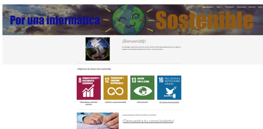
Figura 1: Ejemplo de sitio web (curso 2019-20)

lacionados con el comportamiento ético en el ejercicio profesional actual en dirección de proyectos [14].