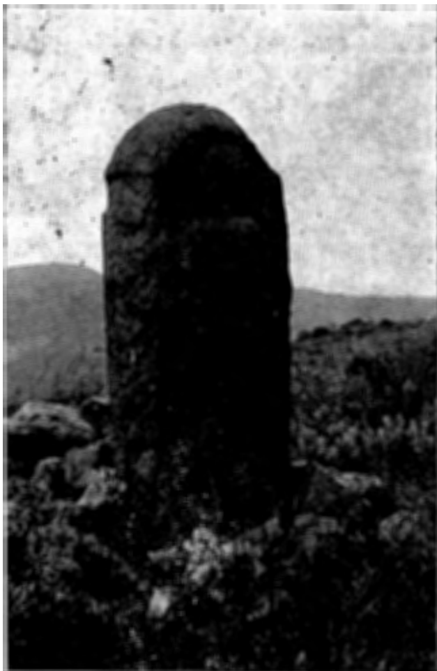
Fig. 2: Piedra de la Pastora, en Larrea (Pradilla-Ezcaray, Logroño)

Sus padres le ordenaron que volviera al monte a buscar las ovejas perdidas. Subió a Larrea y allí la acometieron los lobos y la devoraron. En el mismo lugar se ve ahora un monolito semicilíndrico de forma humana, que en un lado tiene grabada una figura de mujer con un cayado en sus manos y a sus pies esta inscripción: ARAN; lo que, con una coincidencia sorprendente, recuerda el nombre y la leyenda del dolmen de Orozco (1) figura 2.