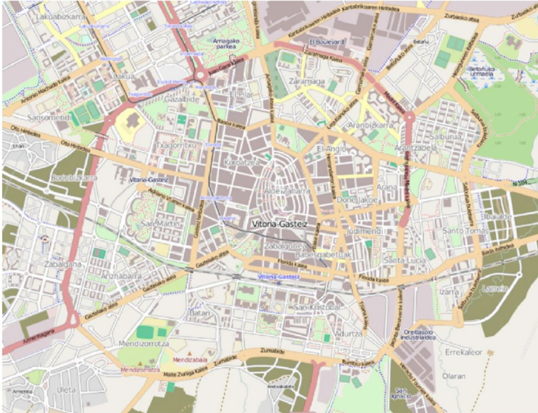
Plano urbano de Vitoria-Gasteiz