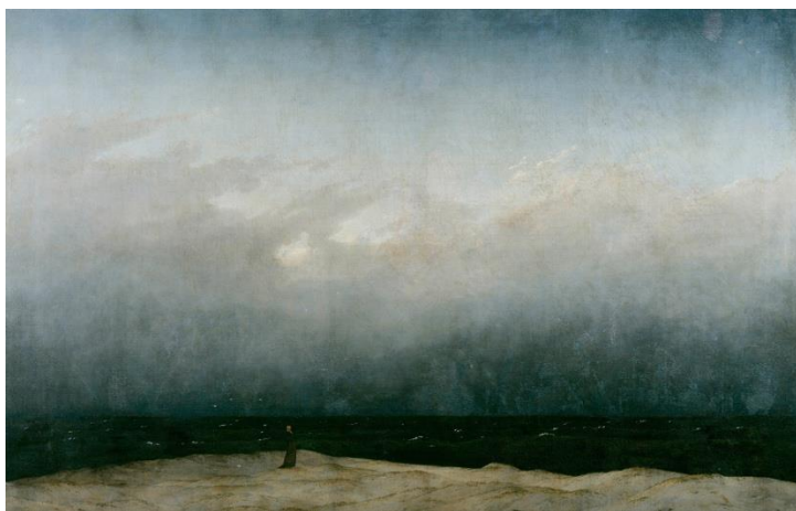
FRIEDRICH: Monje a la orilla del mar , 1808-1810