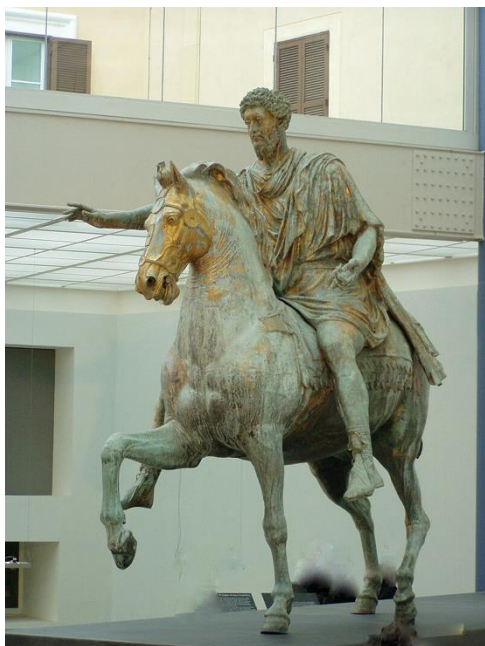
Marco Aurelio Ecuestre, siglo II, Roma