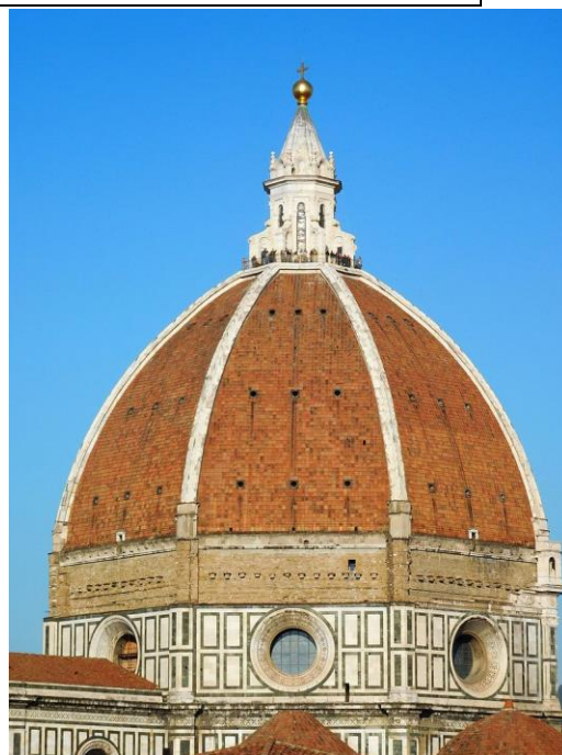
BRUNELLESCHI: Cúpula de la Catedral de Santa María de las Flores , 1420-1436, Florencia