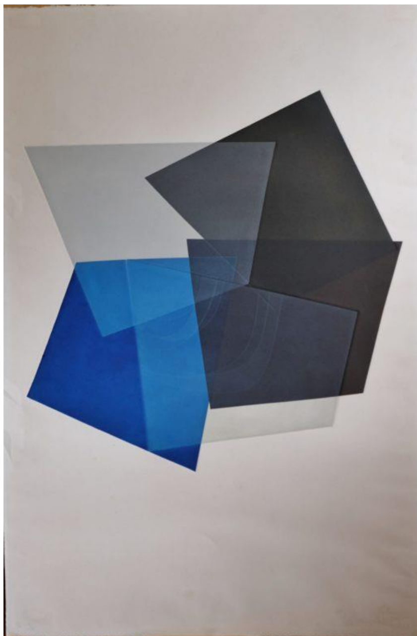
Composición (1953). Amadeo Gabino. Aguafuerte, aguatinta 121 x 80 cm.