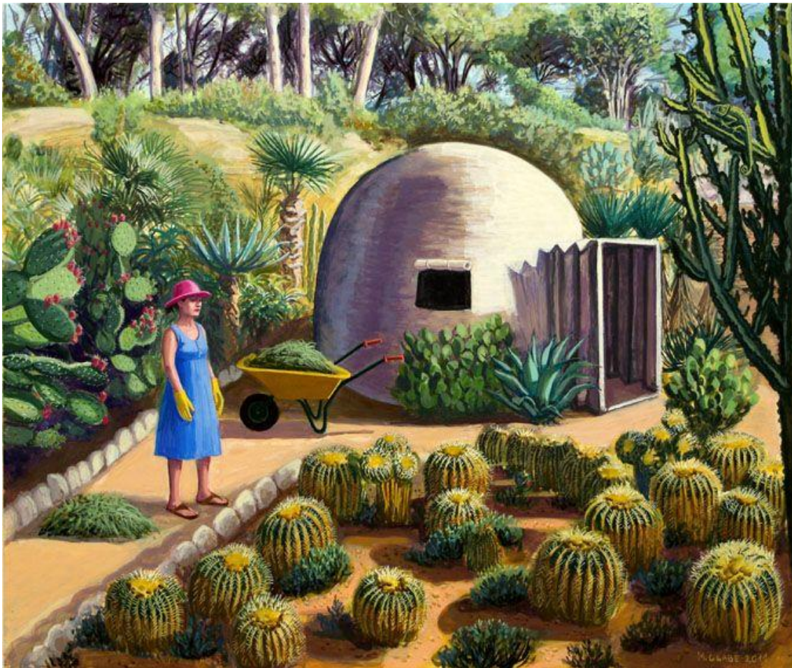
La coleccionista de cactus 3 (2011). Merche Olabe. Temple al huevo sobre tabla.