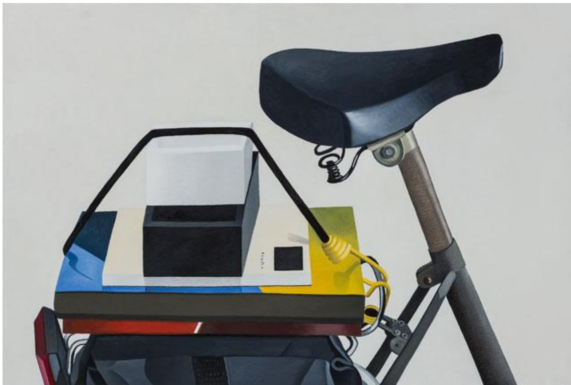
Still life on my bicycle (2005). Nathalie Du Pasquier. Óleo sobre lienzo. 100 x 150 cm.