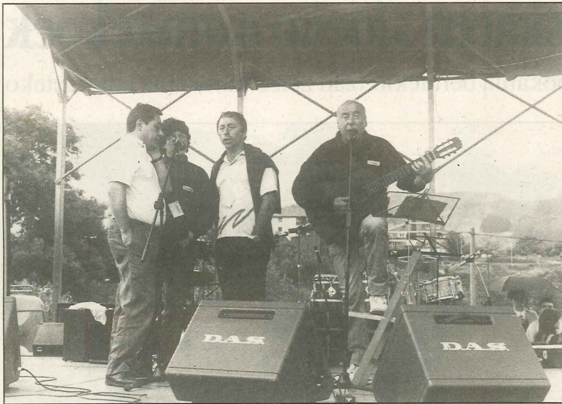
● Egun osoa ekitaldi oparoz bete egon zen, bertsolariak, herri kirolak, kantariak... jendea ase gabe gera ez zedin. Publizitate agentzia bat ere ipini zen bertan. Lizarditan kopuru bat ordaindu eta edonork mezu bat idatz zezakeen, honela mota eta itxura ezberdinetako mezuak itsatsi zituen jendeak. Bazkalostean hasitako euriak ez zuen animoa apaldu eta ilunabarrean aurrera zihoan festa. Galtzaragaina gunean Izotz eta Kazkabarra taldeen emanaldiak soilik geratu ziren bertan behera. Gai nontzekoak bete egin ziren.