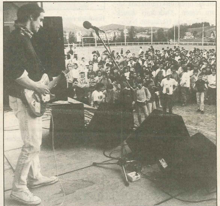
● Pottoka abeslari nafarraren txanda izan zen arratsaldeko seiak aldera Futbol zelairean gunean. Han ere jende apur bat bildu zen eguraldiak horretan lagundu ez arren, arratsaldean euri zaparrada dexente egin bait zuen. A. GILLENEA