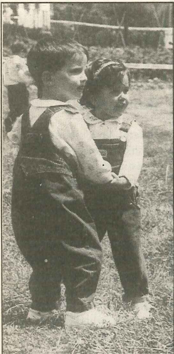
● Dantza egiten ttikitatik hasi behar da. Begira, bestela, bi nes-kato ponpoxo hauei. A.GILLENEA