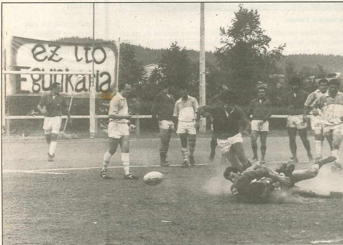
● Hego eta Iparraldekoen artean izandako rugby partiduen garaipena Hegoaldekoentzat izan zen. GILLENEA