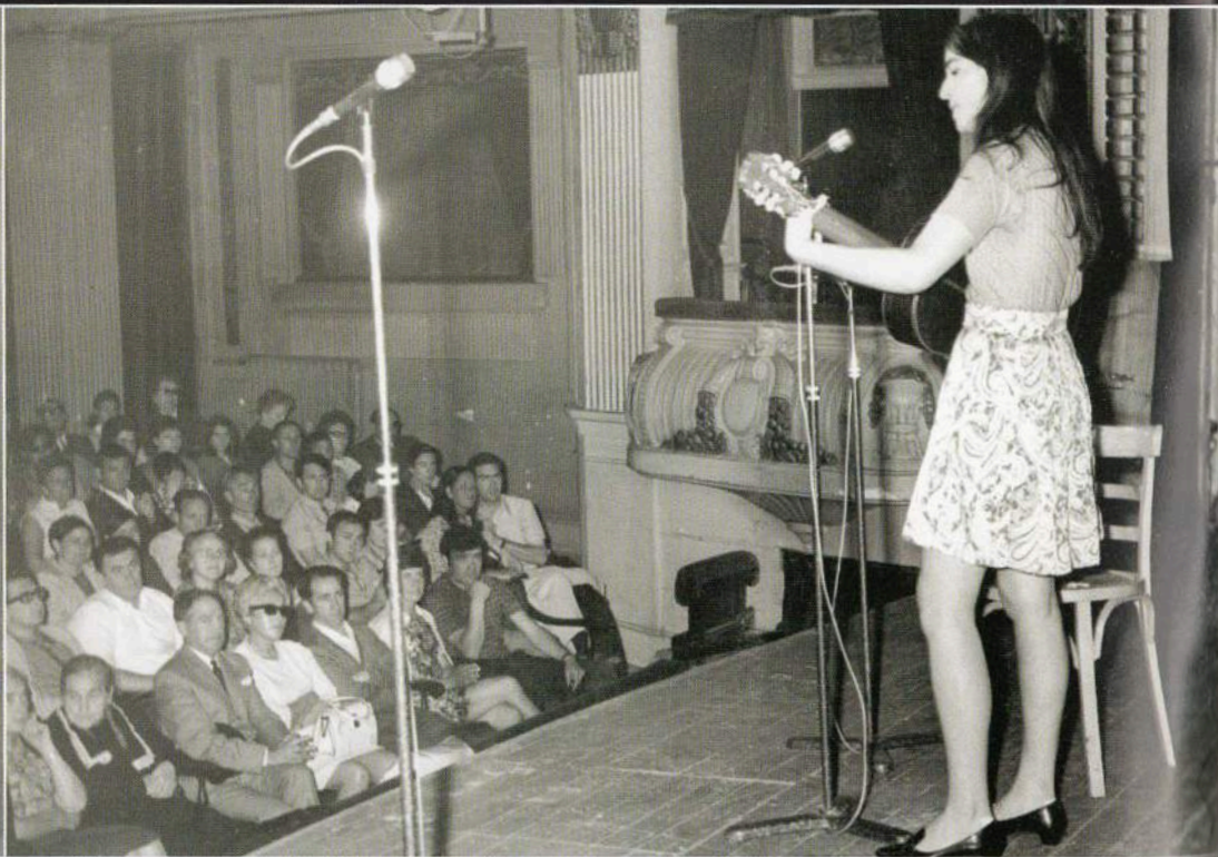
III. Euskal Abestiaren Sariketa, Donostiako Printzipe antzokian (1967). III Certamen de la Canción Vasca, en el teatro Príncipe de Donostia (1967).