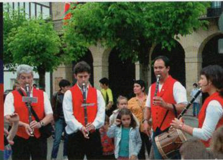
Txanbolin txistu elkarte.