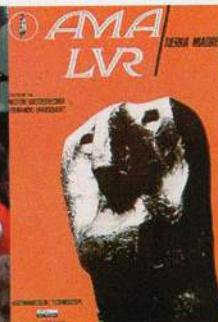
Carátula del film "Ama Lur".