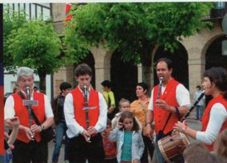
Asociación de txistu Txanbolin.