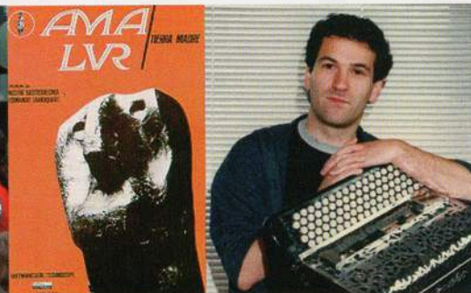
"Ama Lur" filmaren karatula. Joxean Goikoetxea. (ARGIA)