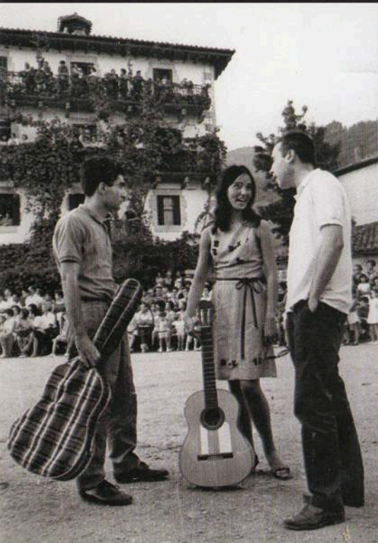
Xabier Lete, Lourdes Iriondo eta Mikel Laboa, Beran (1968). Xabier Lete, Lourdes Iriondo y Mikel Laboa, en Bera (1968).