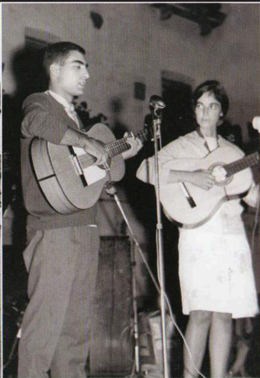
Xabier Lete eta Lourdes Iriondoren lehen saioa Urnietan (1968). Primera actuación en Urnieta de Xabier Lete y Lourdes (1968).