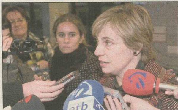
La consejera de Cultura Miren Azkarate atiende a los medios.