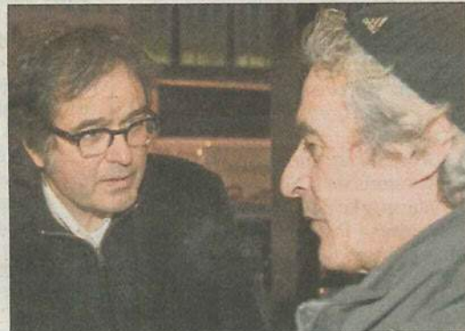
El cantautor Ruper Ordorika conversa con un amigo.