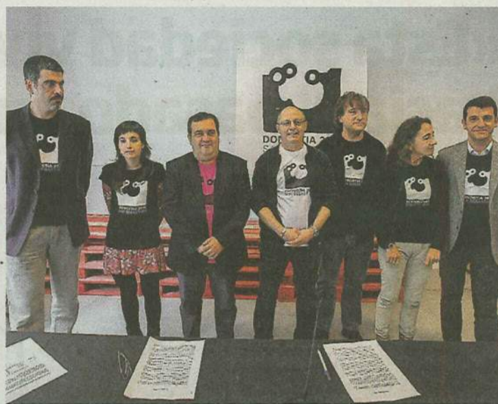
El alcalde y grupos municipales en apoyo a 2016.