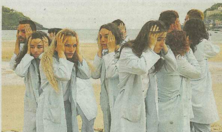
También se recuerda la faceta de Laboa como neuropsiquiatra infantil.