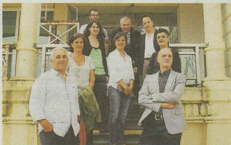
Representantes de ambas formaciones artísticas.