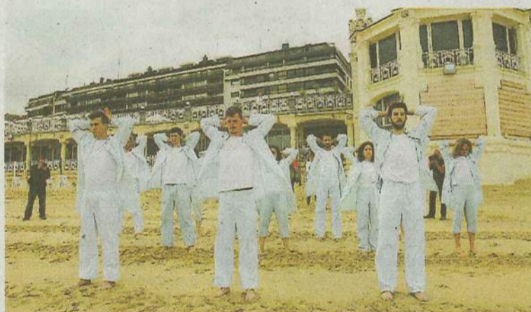
La obra se estrenará en Lekeitio y aspira a ir a festivales europeos.