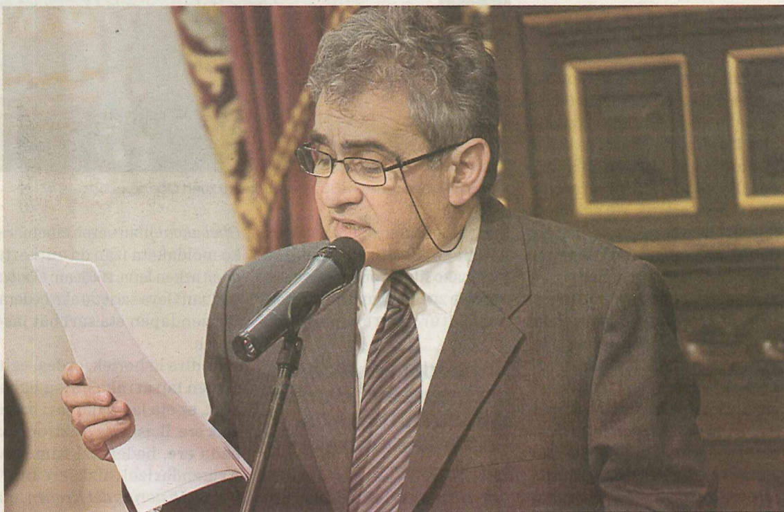
Bernardo Atxaga, Mikel Laboaren laudoriozko hitzaldiaren une batean.

«Askatasunak, artearen alorean, bi lan eskatu izan dizkio