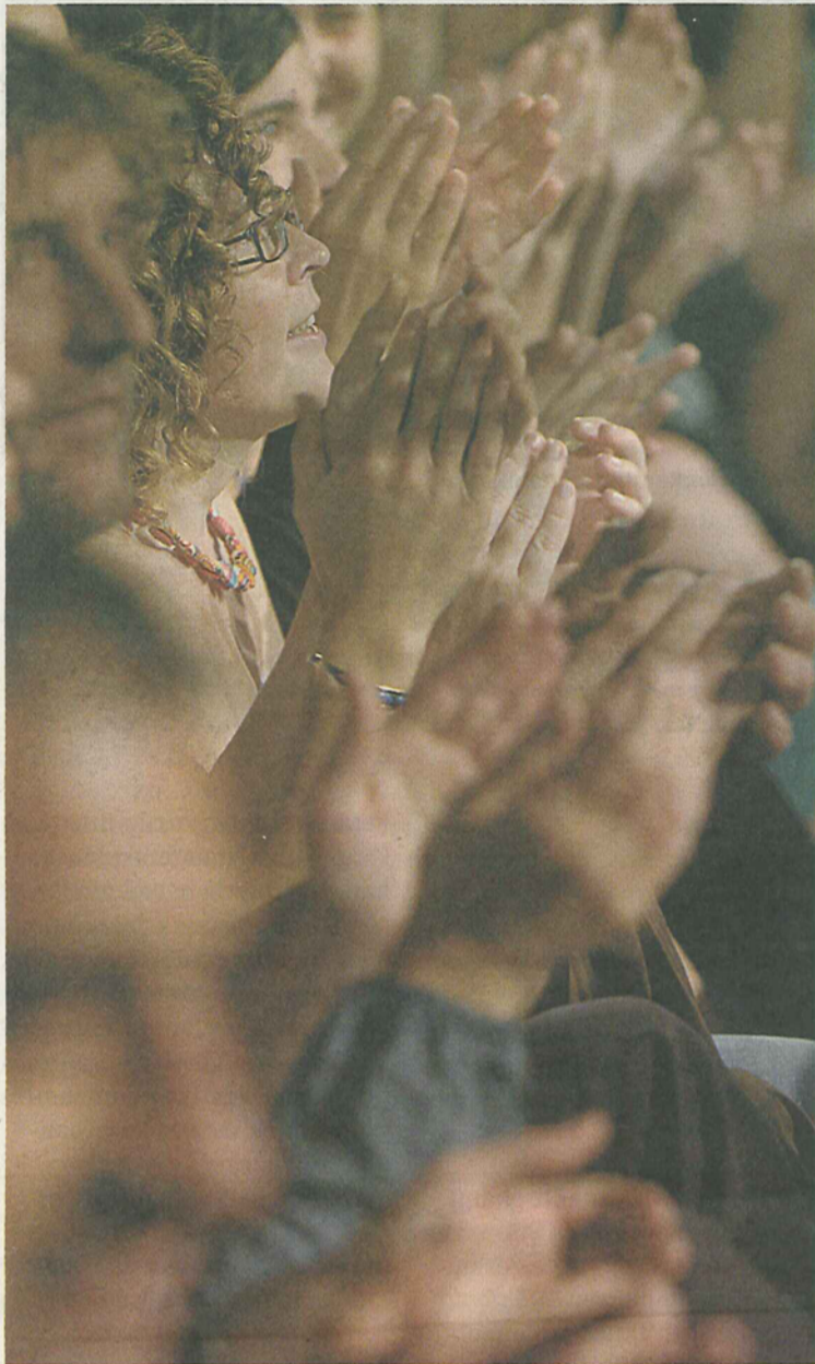
Jendea txalo egiteko gogoz, bero eta hunkiturik zegoen hasieratik.

42 » Agustin Fernandez Mallok poesiaren gaurkotasun eza salatu du bere saiakeran