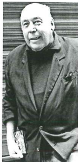
Mikel Laboa, en los noventa.

Un jovencísimo estudiante de Medicina formó en 1965 junto con artistas Benito Lertxundi, Lourdes Iriando o Xabier Lete el grupo 'Ez dok amairu'. Pero el tiempo ha demostrado que fueron mucho más que trece, fueron la voz del pueblo vasco TEXTO Maite Redondo