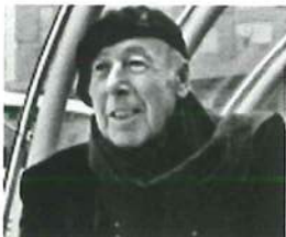
Mikel Laboa, en 2005.