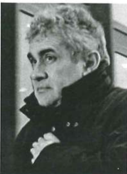
Bernardo Atxaga Escritor

La mirada triste de Xabier Lete se cruzó ayer con aquellos compañeros que acudieron al tanatorio de Rekalde para dar su último adiós a Mikel Laboa. Con un emotivo abrazo recibió al escritor Bernardo Atxaga y permaneció en el tanatorio buena parte de la mañana y de la tarde. "Era un artista muy especial. Su manera de cantar y de expresarse imprimía a sus canciones un halo de misterio", afirmó ayer. Lete, que conoció a Laboa en 1965 al crear el grupo 'Ez dok amairu', subrayó también la amplitud y proyección de su trabajo: "Como personaje y por su larga trayectoria en la música y en la canción vasca se convirtió en un modelo. Es una referencia que quedará para siempre". Por otro lado, el poeta recordó que mantuvo más relación "física" en los tiempos de 'Ez dok amairu'. "Aún así siempre que nos veíamos nos tratábamos con mucho cariño. Es una pena que se haya ido. Una pena", concluyó un emocionado Lete. >C.T.