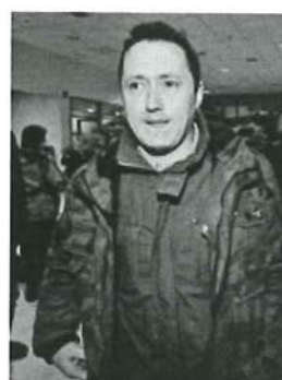
Fermín Muguruza Músico

"Como les pasa a muchos artistas era muy tímido y estar en el escaparate le ha procurado mucho sufrimiento. De ahí que en los últimos años perdiera la costumbre. Aún así era un animal adorable".