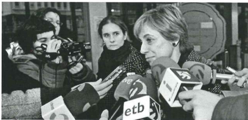
Miren Azkarate recordó ayer al cantautor vasco.

Sin barreras, experimental y vanguardista, nos regaló una obra sin fronteras idiomáticas, reglas fonéticas, estilos musicales o herramientas instrumentales. Anclada en la tradición vasca, pero elevándose para recalcar en puertos más alejados. Como el de la ópera, la canción latinoamericana, el minimalismo, el jazz, el fado, el dadalismo, lo teatral, el flamenco, la canción francesa... Raimon dijo que ningún país tiene una única voz. Que ninguna puede representarlo. Tiene razón, pero la de Laboa, cazador de emociones ("arma, tiro, pun") se erige como la que más se le acerca al referirnos a nuestra querida y doliente Euskadi. Que vuele en paz.