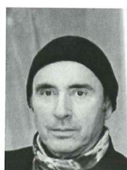
Lluís Llach Cantautor catalán

"Colaboré conmigo en un disco. Y por esa experiencia puedo decir que era una persona muy curiosa, muy alegre y siempre optimista. Es una pérdida importante, pero nos deja su música. Mikel Laboa se va a convertir en un clásico".