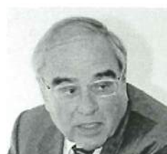
Rodolfo Martín Villa Ex ministro de UCD

= El ex jugador del Tenerife afirma a un diario estatal que él y sus compañeros cobraron, "poco" (6.000 euros), por dejarse ganar en Málaga, lo que impidió que la Real subiera a Primera. El comunicado emitido por el jugador negando estas informaciones deberá ser ratificado con una investigación.