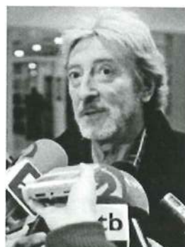
Benito Lertxundi Músico

"Era un artista muy especial. Por su larga trayectoria en la música y en la canción vasca se convirtió en un modelo. Es una referencia que quedará para siempre. Imprimía a sus canciones un halo de misterio".