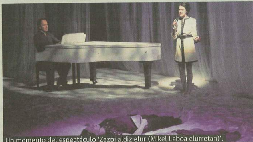
Un momento del espectáculo 'Zazpi aldiz elur (Mikel Laboa elurretan)'.

Donostia. A las 20.00 h. en el Teatro Principal.