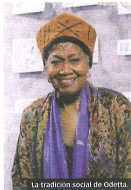
La tradición social de Odetta.