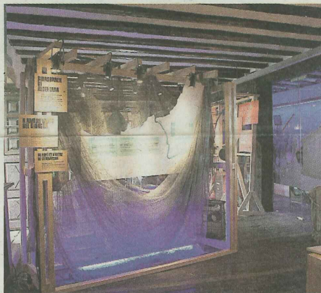
Bi erakusketa. Goian, San Telmo Museoan 'Badu, bada'. Behean, Beasaingo Igartza jauregiko 'Gu itsasoa', urtarilerara arte iraungo duena.

tiak dira errespetagarri. Aspaldi esan zuen Cervantesek berak, 1605eko 'Don Quijote' hartan, beste 'post-it' batean irakurri dudanez: «Homero handiak ez zuen latinez izkiriatu, grekoa zelako; ez eta Virgiliok grezieraz ere, latindarra zelako. Azken finean, antzinako poeta guztiek esnetan edoski zuten hizkuntzan izkiriatu zuten, eta beren kontzeptuen goratasuna azaltzeko ez ziren atzerriko hizkuntzen bila joan; eta hau horrela izanik, arrazoizkoa litzateke ohitura hau nazio guztietan hedatuko balitz, eta aleman poeta ez gaitzeste bere hizkuntzan izkiriatzen delako, ez gaztelaua, ez eta berean izkiriatzen duen bizkaitarra ere».