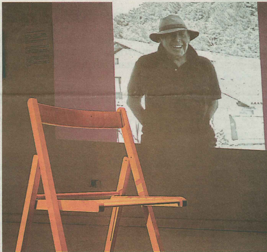
Areto batean, aulki bakarra jarri dute. ETXEPARE INSTITUTUA

Entzumenarekin jarraitu beharreko erakusketa da, komisarioak azaldu duenez. IPadak prestatu dituzte Laboaren kanta ugarirekin, eta haren ahotsak eta abestiek gidatzen dute bisitaria. Nolanahi ere, bada zer ikusi ere; Laboaren diskoen azalak zintzilikatu dituzte hormetan, eta bideo ugari jarri dituzte ikusgai: esaterako, Danimarkako telebista kate batek Gernikaren inguruan eginiko dokumental bat, soinu gisa Laboaren doinuak dituenak.