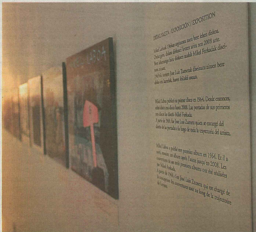
Laboaren diskoen azalak jarri dituzte paretetan. ETXEPARE INSTITUTUA