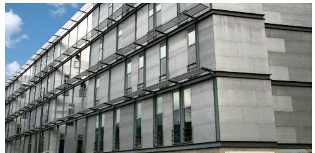
Bilboko Ingeniaritza Eskola