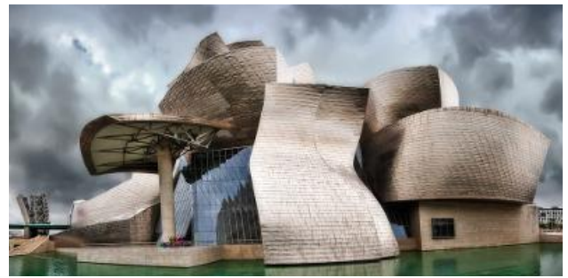
Guggenheim Bilbao Museoa