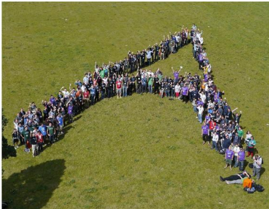
Akademy 2012, Tallinn, Estonia