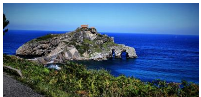
Euskal Herriko ikuspegi ederra